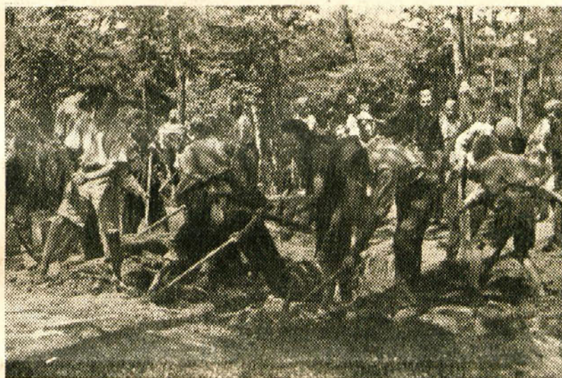
Novomeščani na delovnih akcijah

Tako nekako bodo potekali naši delovni dnevi vse do končne zmage. Marsikaj bomo še izpopolnili; vemo tudi, da se bo hrana