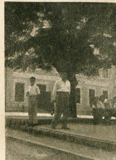
Letoviščarji v Dol. Toplicah

Vprašanje dobre in zdrave pitne vode v zdravilišču Dol. Toplice se vleče že dolga desetletja. Topličani so skupno s kopališko upravo proti koncu prejšnjega stoletja zgradili vodovod iz studenčnega izvirka v 2,5 km oddaljeni vasi Podturn. Zgradba vodovoda je bila že spočetka ponesrečena, ker se graditelji niso ozirali in upoštevali nasvete domačinov glede kraških tal. Jez, ki naj bi zajemal vodo je bil zgrajen na neprimernem mestu in voda je v kraških tleh pod jezom uhajala in tako je ostalo zdravilišče ob suhi brez pitne vode, ker je navadna turbina ni mogla črpati in poganjati v rezervoar. Vse poprave in krpanje jeza je bilo brezuspešno.