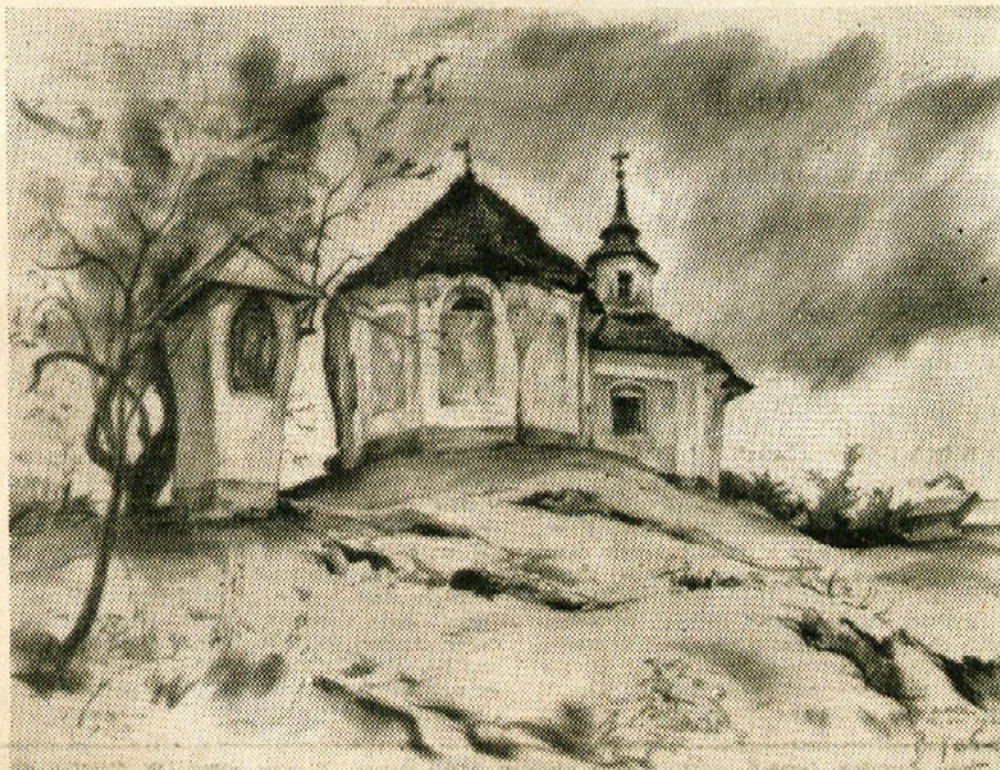
Cerkvica sv. Martina — lapidarij belokranjskega muzeja