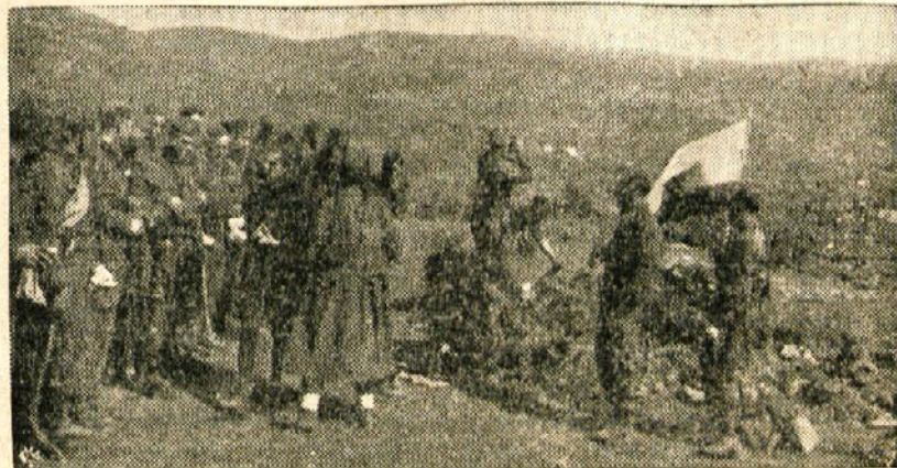
V Beli Krajini je prav vse, mlado in staro, moški in ženske živelo s partizani. In kadar so partizani branili to malo deželico — zibelko ljudske oblasti — so mladinke in žene nosile hrano borcem na položaje.