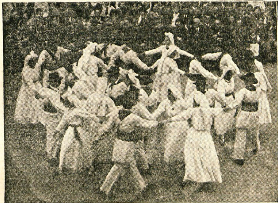
V Beli Krajini sta se med Slovenci najbolj ohranila pristni narodni ples in narodna noša. Belokranjci še danes radi plešejo te plesne in nosijo to nošo.

Množičnim organizacijam St. Jerneja lahko čestitamo, da so priredile prvo kmetijsko razstavo, politično zborovanje in zbor gorjanskih partizanov. To je pot, ki jo želimo pri vseh frontnih organizacijah: delati samoiniciativno in ne čakati samo na navodila od »zgoraj«. Tako, samostojno delo frontnih organizacij je hkrati najlepša priprava na deseto obletnico ustanovitve OF.