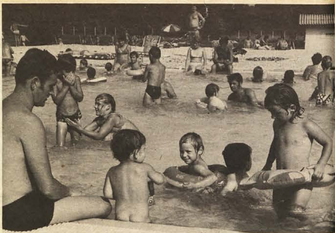
Za otroke je na voljo več plitvih bazenov, v katerih je čofotanje prijetno in brezskrbno.