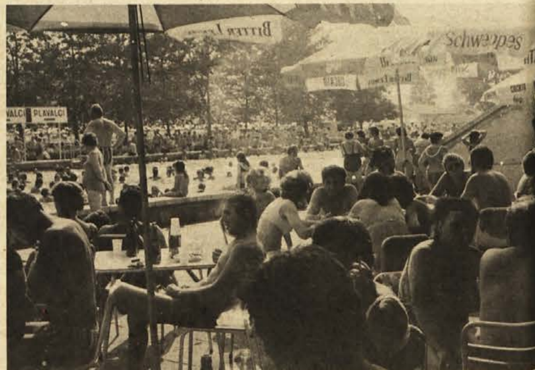
Na kopalšču v Čateških Toplicah imajo več prodajnih mest za pijačo in jedajo, stojnico s sadjem, več prodajalnih sladoleadov in znanih „kremšnit“, kakršne znajo pripraviti le v Čateških Toplicah. Za dobre čevapčiče ali različne računajo le 18 din, kar je ceneje kot drugje.