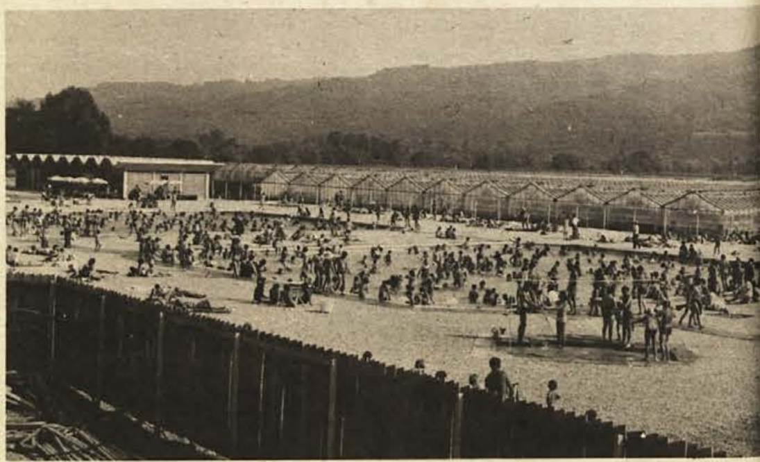
Dva večja bazena, enega za neplavalce, drugega za plavalce, so odprli pred nedavnim.

Z nedavno otvoritvijo novega kegljišča in štirih bazenov so Čateške Toplice pridobile pomemben življenjski prostor za tisoče obiskovalcev. Znebile so se utesjenosti, ki so jo občutili kopalci zlasti ob nedeljah in praznikih, ko sta bila oba bazena prenatrpana. Bili so dnevi, ko se je trlo na kopalšču tudi po 5.500 kopalcev.