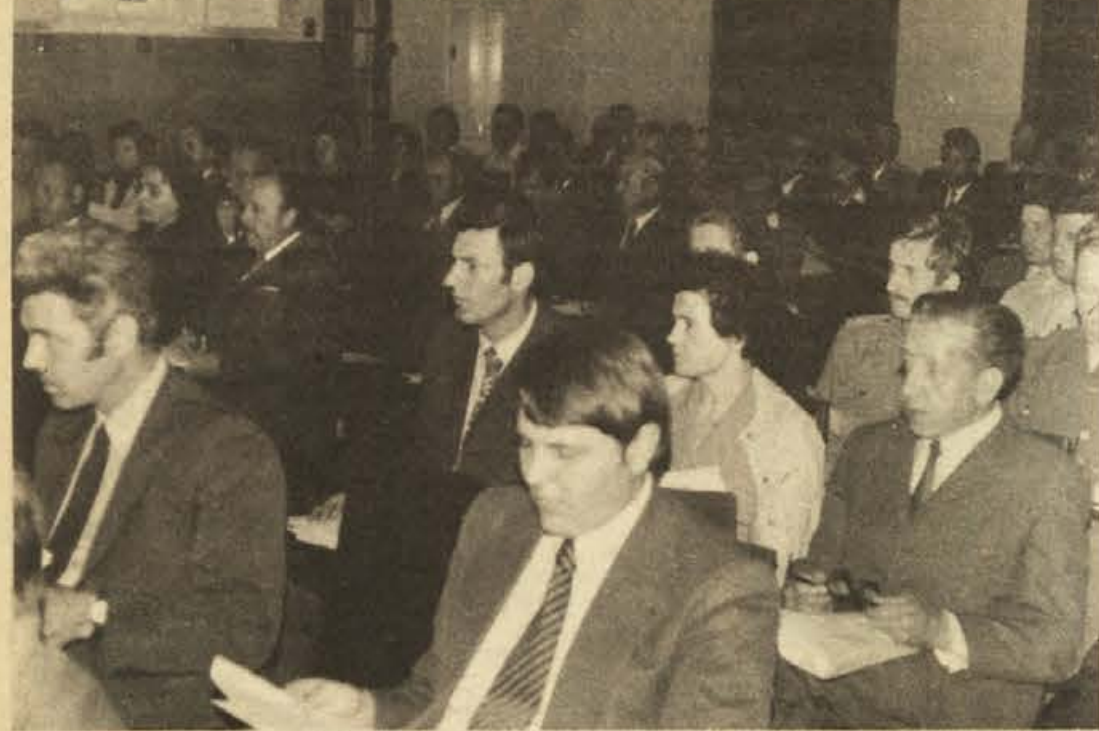
Na prvi delovni seji nove občinske skupščine Ribnica sta manjkala 2 delegata družbenopolitičnega zbora, kar 7 delegatov zbora združenega dela in celo 9 delegatov zbora krajevnih skupnosti. Taka odsotnost s seji ni opravičljiva.

TRŽNICA - Tudi prejšnji petek je bilo na trgu precej gobarjev, ponudili pa so predvsem lisičke in sicer po 6 dinarjev za merico. Ostale cene: hruške po 6 do 10 din za kilogram, jaja po 1 do 1,30, marelice 16 dinarjev, jabolka 6 do 8 din, paprika 18 din, paradižnik 7 din, kumarice 7 din, stari fižol v zrnju 10 do 12 din, breskve 10 din, skuta 15 din, smetana 20 do 25 din, cvetlični med po 30 din kilogram, novi krompir po 3 do 4 dinarje kilogram in jurčki po 35 do 40 dinarjev kilogram.