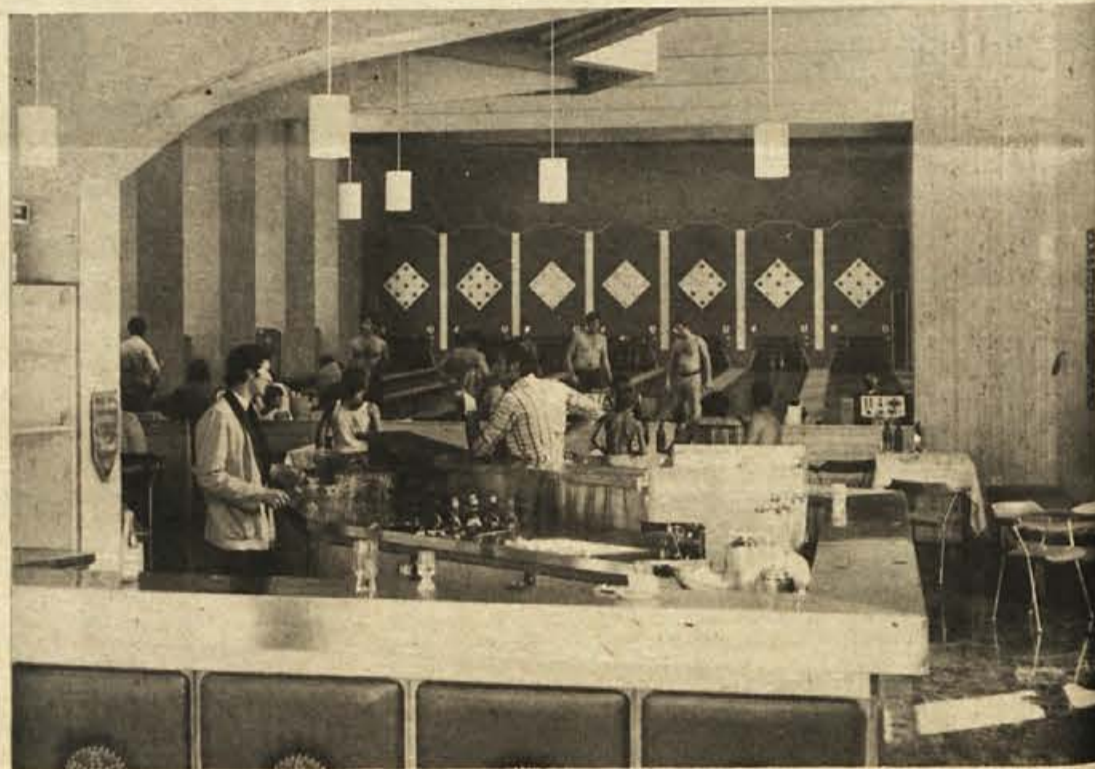
Hkrati z novimi bazeni so v Čateških Toplicah odprli tudi sedemstezno avtomatsko kegljišče, mini-casino in priložna bifeja.