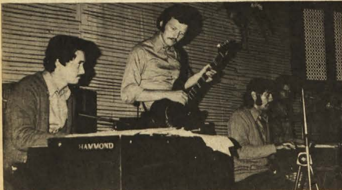
Eden od ansamblov, ki bodo zabavali na letošnji Čateški noči, so VOKALI, ki so jih obiskovalci lani še posebno pohvalili.