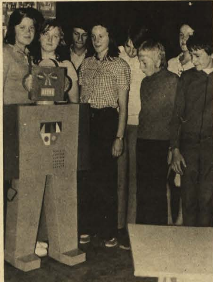
Učenci ribniške POS so prikazali na razstavi ob zaključku šolskega leta veliko zelo lepo izdelanih praktičnih, okrasnih in drugih predmetov, med njimi tudi dva robota, mlin na veter, izdelke ročnega dela, žgane izdelke suhe robe in drugo.

Zaradi pripomb, da je kubik vode po pavšalu dražji kot po vodomeru, bodo ustrezne občinske službe pripravile za prihodnjo sejo skupščine predlog odloka o obveznem vgrajevanju vodomerov.