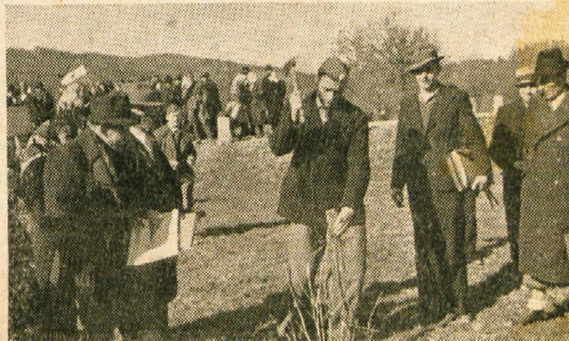
Zemlja se deli tistemu, ki jo obdeluje

Četrty uspeh je bil v tem, da je ljudstvo dobilo v roke vsa prirodna bogastva, vsa proizvodna sredstva, vsa finančna sredstva in vse prometne vezi.