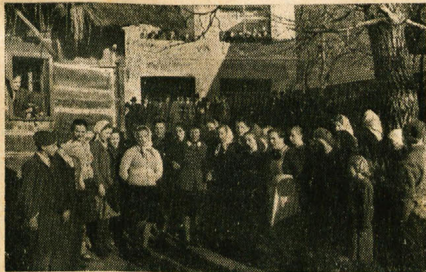
Gaberčani razpravljajo o ustavi

Najslabša udeležba v KLO Mirna vas in St. Lovrenc nad St. Rupertom nam potrjuje, da je delo organizacij samo na papirju. V Mirni vasi ni šla na volišče niti žena predsednika KLO, v St. Lovrencu nad St. Rupertom pa z Jelševca petčlanska družina odbornika KLO. To nam je dokaz, da niti predstavniki ljudstva niso prepričevali in prikazovali pomen volitev ostalim volivcem. Pod takimi pogoji ni čuda, da niti krajevni ljudski odbor ne more dobro poslovati in predstavljati ljudske oblasti, ki bi ji vsekakor moral stati na čelu. Volivci bodo v doglednem času spoznali vse nasprotnike ljudske oblasti, ki so načrtno v posameznih vaseh zavirali izvedbo volitev.