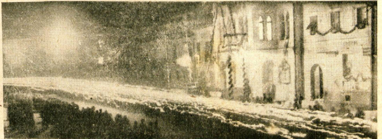
Na predvečer 1. maja 1946 v Novem mestu

Naj živi skupnost delavca, kmeta in delovnega inteligenta!