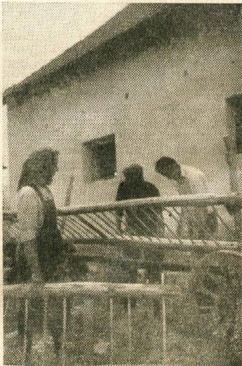
Nov voz bomo dobili

Ko sem odhajal, mi je misel neprestano »bujala spomine na borbe, ki so jih vodili partizani, na sestanke, ki smo jih imeli od okrog in nehotno se mi je vrivala misel: »Pred leti smo vodili borbo proti uničevalcu kulture in človeka, danes pa bojujemo boj za dosego čim lepšega življenja. Nimamo ga še sicer. Imeli ga pa bomo, če bomo imeli take ljudi kakor so v zadrugi prvih gorjanskih partizanov. Drajček