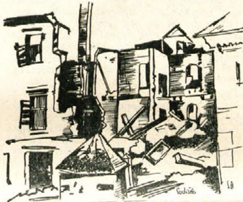
23. julija 1943 so Gubčevci porušili sodišče

Trebnjemu in Zagradcu. Noč je stegala tipalke nad Krško dolino, luči so polagoma odmirale, ko so se borci spuščali od vseh strani v kačastih vijugah proti cilju. Brez šuma in strela so se vtihotapili v trg in z bliskovitim napadom presenetili belogardistično posadko, ki je bila povečini zajeta. Nekaterim se je posrečilo pobegniti k Italijanom v poslopje bivšega trinadstropnega sodišča, ki je bilo izredno utrjeno. Del jurišnih oddelkov je očistil trg posameznih stražarskih oddelkov, drugi del pa je pričel obkoljevati Italijane v sodišču. Kljub strahotni obrambi, saj so ročne bombe frčale kot toča, se je nekaterim udarnim skupinam posrečilo prebiti se do sodišča. Na vdor v notranjost sodišča spričo strahotne obrambe ni bilo misliti, preveč bi bilo žrtve po nepotrebnem. Parkrat