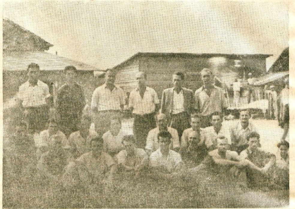
Ti udarniki so z velikimi napori zgradili in postavili Tovarno učil v Crnomlju v obrat in dosegajo velike uspehe.

zaradi pomanjkanja materiala ali njegove slabe kvalitete presežen v splošno zadovoljstvo odjemalcev. Izdelal bo proizvodni plan za leto 1951 v smislu sklepov zvezne konference, ki se je vršila ob navzočnosti za-