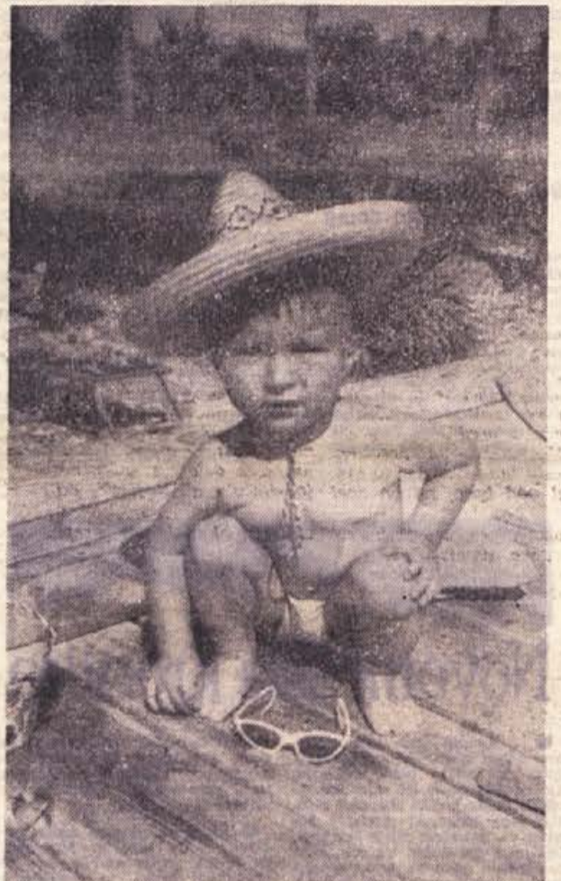
Lani je letovalo iz videmsko-krške občine samo v počitniškem domu v Materadi pri Poreču kar 1200 ljudi. Veliko jih je počivalo in si nabralo novih moči v raznih drugih domovih ob Jadranu in v planinah. Občinski počitniški dom v Materadi je nudil veliko prijetnih uric tudi 280 otrokom. Slika prikazuje zadovoljnega mladega Krčana na pomolu pred domom v Materadi.

Skozi gručo si utiram pot k hotelu. Od sončnih dni v času puljskega filmskega festivala ni ostalo ničesar. Le veter se zaganja v zidove arene. Branko Lukić