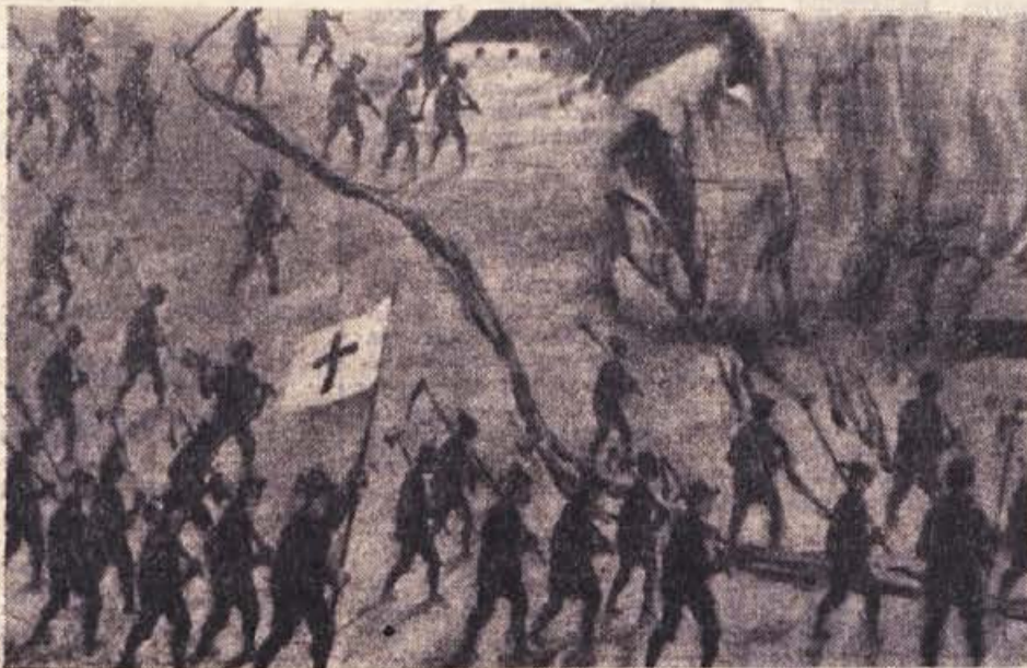
MIRO KUGLER: Detajli iz »Kmečkih uporov« (1962)

Na seji obeh zborov ObLO je bil sprejet odlok, ki določa, da smejo proizvajalci vin porabiti doma brez plačila prometnega davka v proizvodni dobi 1962-63 po 120 litrov vina na osebo, starejšo nad 15 let.