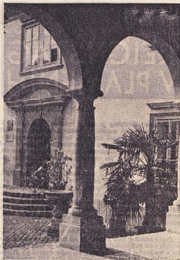
Vhod v študijsko knjižnico MIRANA JARCA

Največ knjig si izposojajo dijaki gimnazije in osemletke; teh je kar dobra polovica vseh strank. Upamo pa, da bomo v letošnjem letu pritegnili k branju še več občanov, tudi starejših, ki bi jim bila dobra knjiga lahko prijetno in poceni razvedrilo. M. K.