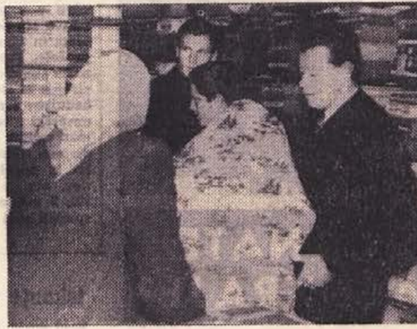
»Le pogledite, kako je lepo! Vzorec je primeren, kvaliteta je dobra, koliko smem odrezati?« povprašuje prodajalec v trgovini. Prizor je ujel naš objektiv v preurejeni prodajalni »Preskrba«, trgovskega podjetja »Krika« v Brežicah. V noveletnih dneih je bilo v vseh trgovinah polno, ljudje pa so hiteli nakupovati