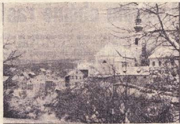
Metlika v beli odeji

KOZERIJA, KI PA NA ŽALOST LE NI KOZERIJA