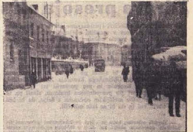
Podoba teh dni v Novem mestu

Organizacija SZDL Novo mesto — center šteje danes že nad 160 članov in je ena najmočnejših v novomeški občini. Izdaja glasilo, ki so ga najprej tiskali v nakladi 400 izvodov, do konference je izhajalo v 700 izvodih, zdaj pa nameravajo naklado povečati na okrog 900 izvodov. Kaže, da je glasilo med članstvom zelo priljubljeno in bodo odslej pisali vanj tudi člani (do zdaj so ga sestavljali le člani odbora), kar