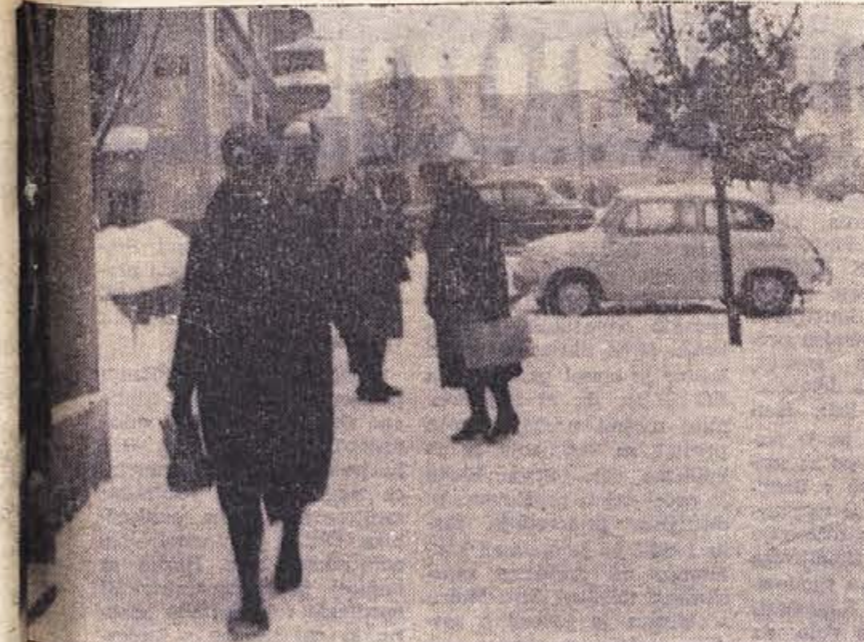
»Halo, halo!« in nazadnje odložil slušalko. »Hudiča, še zvezte so zmrzile...«

Uslužbenec neke večje novomeške ustanove je vrtel telefon, ponavilj »Halo, halo!« in nazadnje odložil slušalko. »Hudiča, še