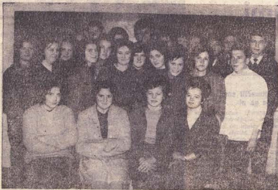
Mladi gostinci v tečaju novomeškega Zavoda za napredek gostinstva in gospodinjstva