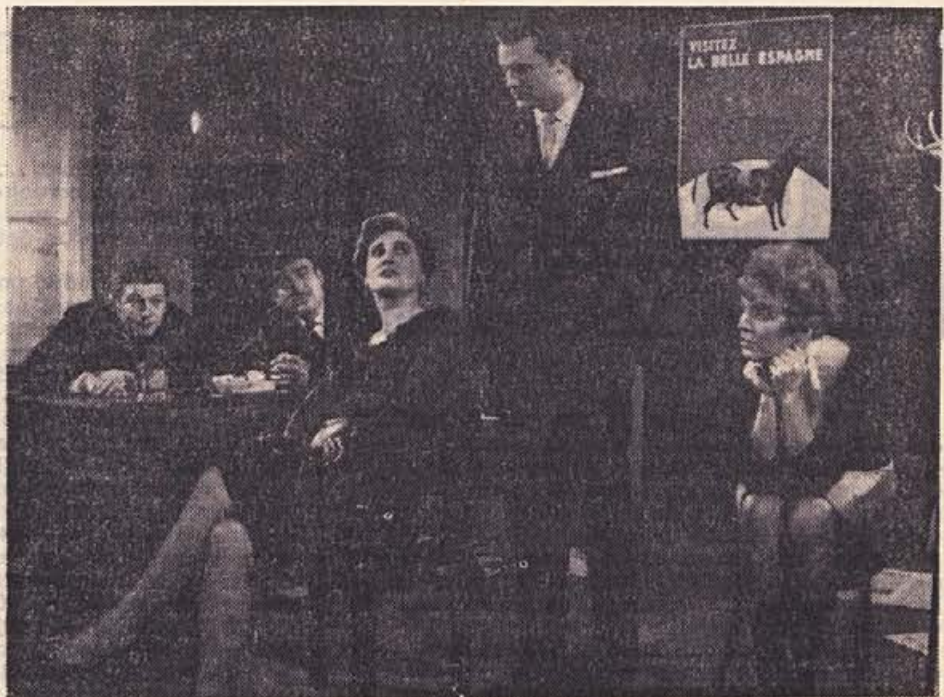
Frizorček iz ODKRITOSRČNE LAŽNIVKE, kateri je avtor pripisal tale motto: »Kdor govori resnico, temu daj konja: potreboval ga bo, da bo lahko pobegnul... (perzijski pregovor). Celjski umetniki bodo nastopili z Achardovo komedijo v soboto zvečer ob 19. uri v Kostanjevici na Krki

Največja želja prebivalstva trebanjske občine, učencev in šolnikov je, da bi skoraj odprli novo šolo. Šola, ki jo gradijo v Trebnjem, bo ena najmodernejših v Sloveniji. V njej bo 10 učilnic, 2 delavnice za tehnični pouk, risalnice, fizikalna dvorana, kabineti, splošni kabineti, prostori za šolsko mlečno kuhinjo, prirodoslovna soba in upravni šolski prostori. V načrtu je tudi telovadnica, ki je pa, kot smo izvedeli, ne nameravajo graditi, čeprav bodo utrdili učivalnico in slačilnico, ki bo služila pri pouku telesne vzgoje. Toda brez telovadnice modernega pouka ni, zato se bodo morda le našla sredstva, da bodo uredili tudi prostore za pouk telesne vzgoje.