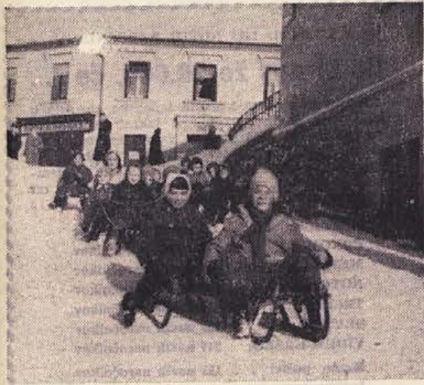
Vsak klanček izkoristijo — saj vendar kar 14 dni ne bo sole in snega, snega nikjer ne manjka!