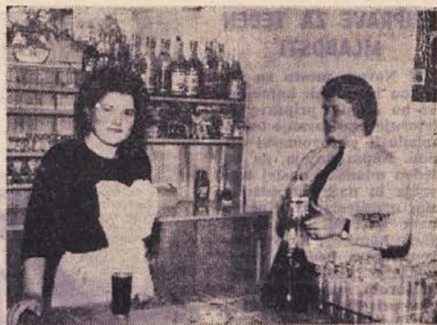
Gostišče na Veselici dobiva čedalje več pohval: izredna čistoča, dobra postrežba, pristna domača vina, nizke cene in prisrčna gostoljubnost osebja — vse to vpliva na goste, da radi obiščejo to lepo razgledno točko nad starodavnim mestom.

Na seminarju se seveda razpravlja tudi o bližnjih volitvah v občinske skupščine, na katere se začnejo krajevne organizacije SZDL že zdaj pripravljati. Od volitev nas ločita samo dva kratka meseca, dela pa je precej. Zato bo treba vrste Socialistične zveze okrepiti, razširiti in poglobiti celotno dejavnost. Menda bo tudi čas, da se vsi zaposleni delavci in uslužbenci odločijo za vstop v organizacijo SZDL — presenetljivo veliko jih je namreč še vedno izven vrst naše najmnogičnejše organizacije! Le čemu neki?