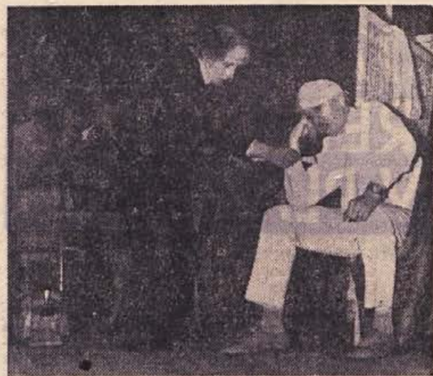
KUD »Ivan Cankar« iz Leskovca pri Krškem je uprizoril v soboto in nedeljo komedijo Draga Gervaisa Zaradi stanovanja.