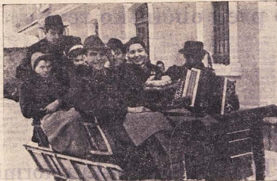
Svatovanje je najlepši dan v družini na Dolenskem. Dolga in ostra zima je spravila izpod pristrstevkov vse sani in ko pridejo vse priče in godce, se začne vesela pot...