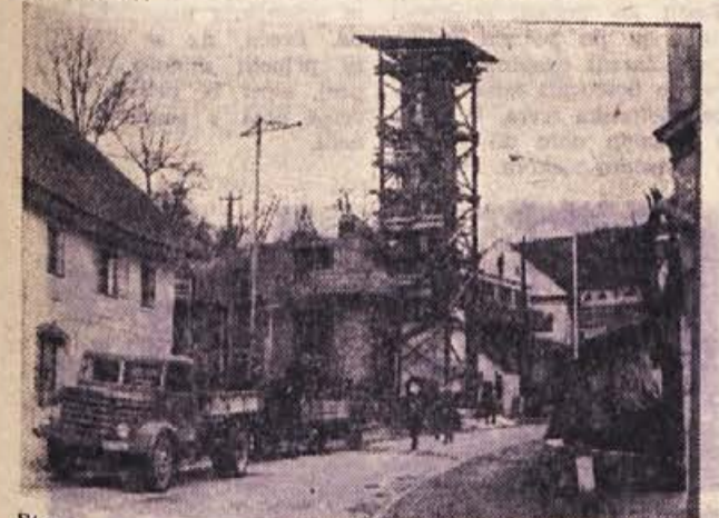
Stolp gasilskega doma? — Ne, na sliki vidimo samo leseno konstrukcijo ob zidovju nastajajočega hotela v Metliki. Zadnje dni so z gradnjo pohiteli, ker je marčevo, še bolj pa aprilsko vreme velik sovražnik gradbenikov. Pohiteti pa je treba tudi zato, ker bo, kakor pravijo, šele ta hotel poživil metliško gostinstvo in turizem