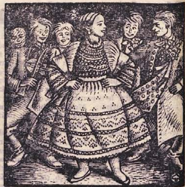
Merčin Nowak-Njehornski: ILUSTRACIJA (iz »LETECE LADJE« in drugih lužiskosrbskih pravljic; izdala Mladinska knjiga v Ljubljani, 1959)

Po posvetovanju so člani posameznih organizacij razpravljali v komisijah. Tu so skušali prilagoditi svoje črje programe sklepom posvetovanja.