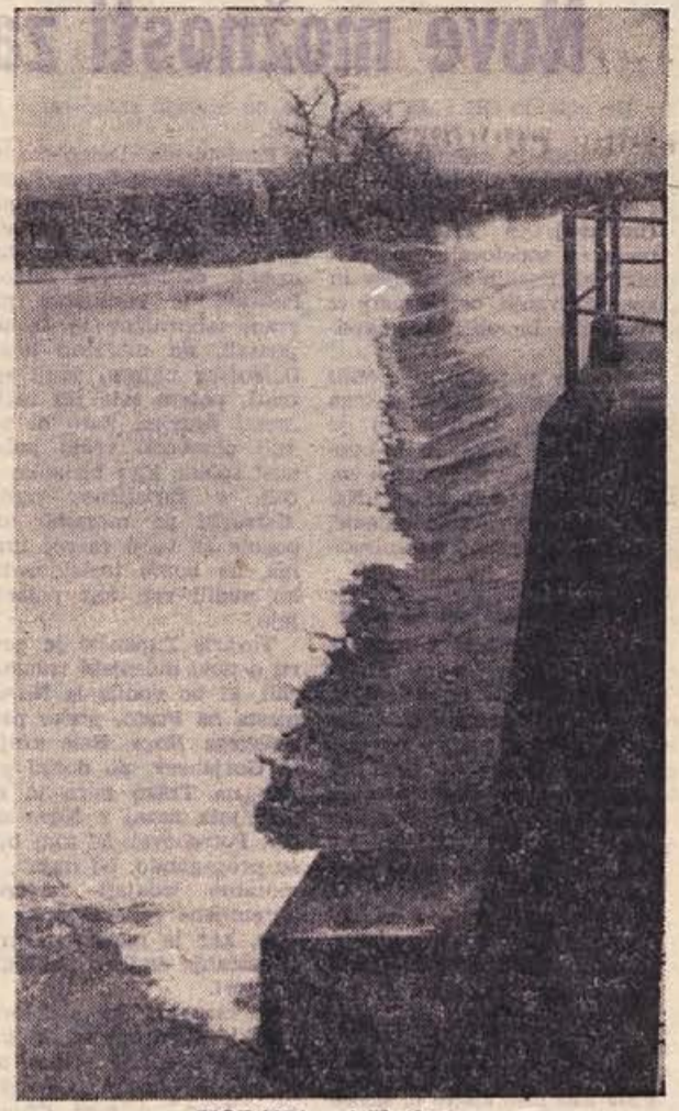
KORANA pri Karlovcu

■ Dalmatinske ladjedelnice »Splitska«, »Mosora« iz Trogira in »Ivan Cetinić« iz Korčule bodo letos dobavile inozemskim naročnikom 15 ladij in drugih plovnih objektov v vrednosti 25,7 milijona dolarjev.