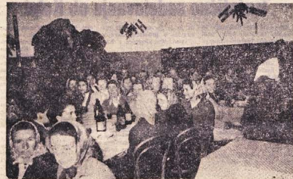
Da je postal 8. marec resnični praznik naših delovnih žena, naj pove tudi ta fotografija, posneta v Drči pri Sentijerneju 17. marca: tudi tu so žene množično in prigrčno lepo počastile mednarodni ženski praznik. Obudile so spomin na minula leta in v prijetni družbi pokramljale o tem in onem, kar doživljajo, delajo in čutijo. Takih srečanj je bilo letos povsod veliko — dokaz, da je iz leta v leto dan žena resnično bolj ljudski praznik

Po sporazumu bo znašala vrednost letošnje trgovinske izmenjave med našo državo in Mongolijo 1,2 milijona dolarjev, kar je znatno več kot v preteklem letu.