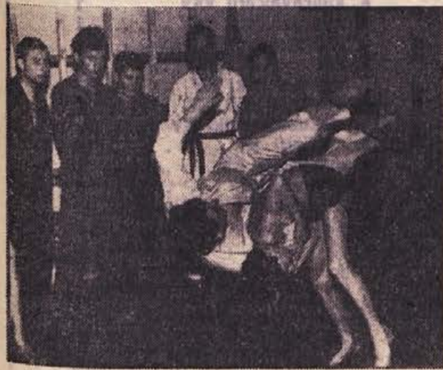
Učenec preizkuša svoje znanje na učitelju.

Upamo, da bo imel takrat ta šport še več pristašev, prizadevnim judoistom pa želimo čim hitrejšo napredovanje. M. P.