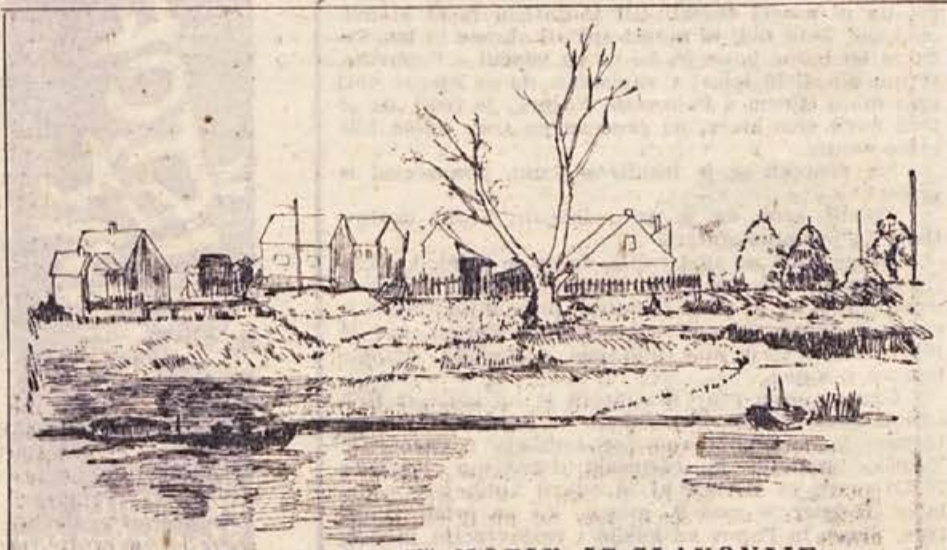
Zdenka Golob-Borčič: MOTIV IZ SLAVONIJE