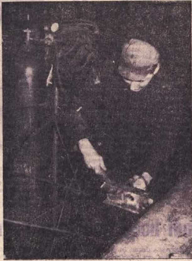
Delavec Obrtnega kovinskega podjetja Dobova pri delu. Lani je prizadeveni kolektiv, ki je pred nekaj leti z lastnimi močmi ustvaril obrat, naredil že za 122 milijonov dinarjev vrednosti.