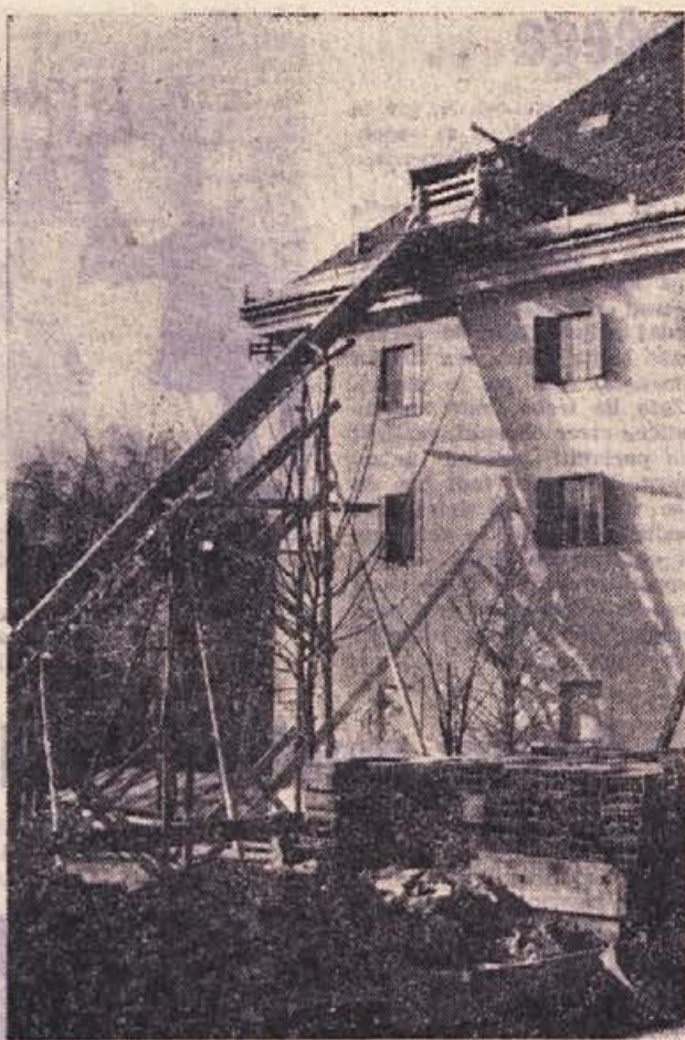
Razglednica iz Dolenjskih Toplic: takšne so te dni, ko so začeli nadzidavati stavbo zdravilišča. Začelo se je delo, da se Dolenjske Toplice spremene v močno revmatološko središče

Na nedavnem zboru volivcev so Žužemberčani našli več problemov, ki bi jih bilo treba rešiti skladno z družbenim planom občine. Tako so povedali, da je treba na vsak način najti sredstva za dograditev žužemberškega vodovoda, ureditev gradu v Žužemberku in za odstranitev ruševin.