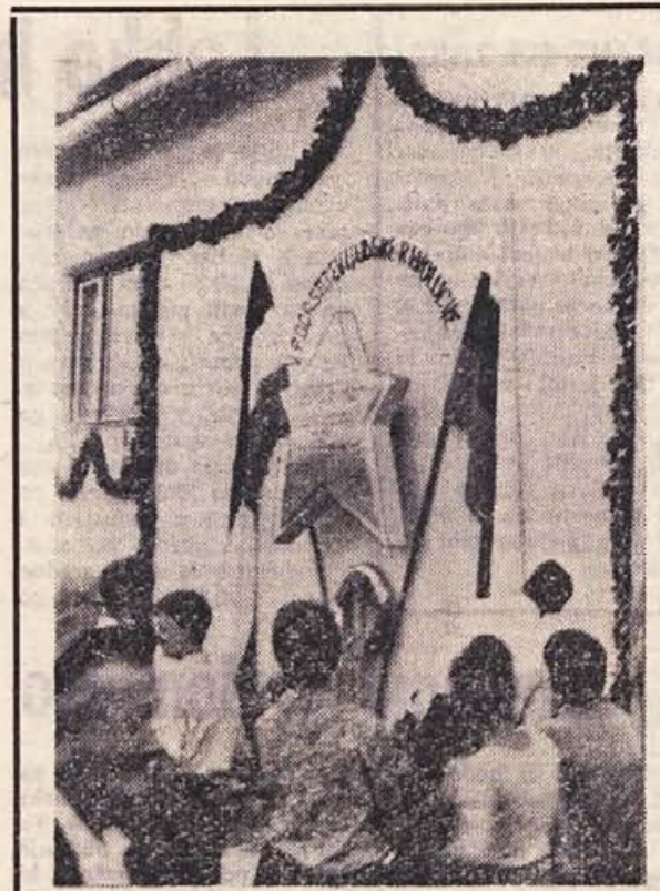
»V POGASTITEV LJUDSKE REVOLUCIJE« je vzdignana marmornata peterokraka zvezda na gasilskem domu v Podturnu in na njej imena padlih junakov, borcev NOB, ter žrtev fašističnega nasilja te zavedne doline