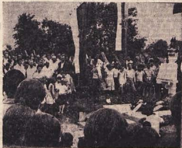
Pogled na del udeležencev proslave ob odkritju spomenika v Adlešičih

vice. Šestindeset domačinov je padlo v boju ali izgubilo življenje v internaciji in zaporih, tri sovražne akcije niso ukrotile upornega duha tega prebivalstva, ki je tudi danes prav tako zavedno kot takrat. Tik pred osvoboditvijo, to je 22. marca 1945, se je fašistična drhal poslednjč zdvijala nad temi