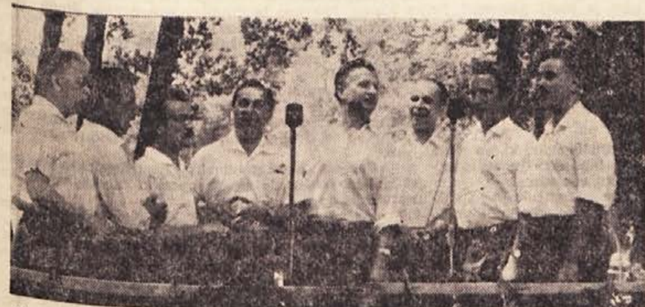
»Oktober boste naši! Na svidenje v Chicagu! Fantje, kako lepo pojetje!« — tako in podobno so vzklikali ginjeni rojaki Slovenskemu oktetu, ki je zapel na Otočcu vrsto narodnih in umetniških pesmi. Oktobra bodo gostovali pevci našega znanega okteta v ZDA in morda tudi v Kanadi, že zdaj pa se rojaki okraj velike luže veselijo njihovega obiska in umetniškega užitka