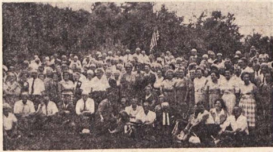
Pretežni del rojakov na pikniku v četrtak opoldne na Otočcu: »Da bo za spomin na 4. julij 1963 v stari domovini!«