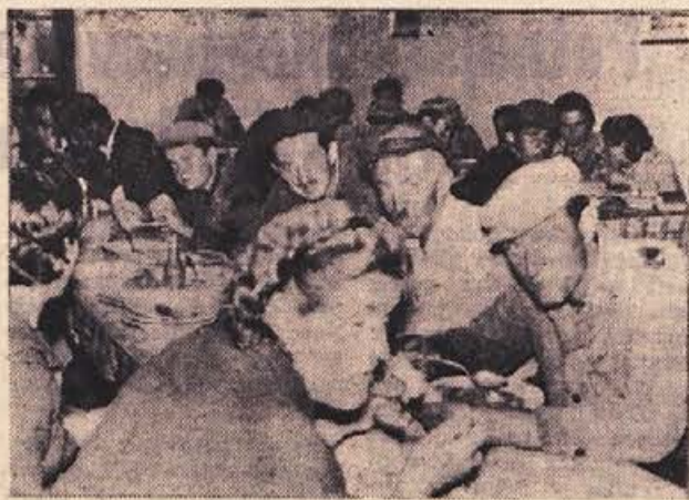
V opekarni v Zalogu smo zalotili kolektiv pri dopoldanskim malici. Okusno enolončnico, ki s kosom kruha vred velja delavca 65 dinarjev na dan, so vsi pohvalili, tako da si je kuharica, ki je prisluškovala pri lini, oddahnila, ko je slišala samo pohvalo...

Gob je bilo v Topliški dolini tudi letos zelo veliko. Po gozdovih je vsak dan polno ljudi, ki nabirajo gobe za prodajo ali pa jih vložijo in posuše za zimo. D. G.