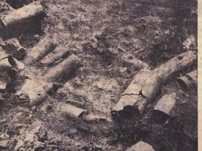
Skladništvo rimskih vodovodnih cevi v Veliki vasi pri Leskovcu ob peč, ki so jo odkrili poleti 1961

Izkopali smo ker smo hoteli zvedeti, kakšen obseg in kako daleč je segalo mesto, kje so potekale ceste, kakšen je bil tloris njegovih hiš in kakšna je bila njihova komunalna ureditev. Naše delo ni bilo zaman. V preteklih letih smo poleg izredno številnih drobnih najdb lončene posode, rimskih novcev, naklinskih predmetov, slikanega stenskega ometa in številnih zidov dobili tudi jasnejšo podobo o ureditvi samega mesta. Izkopavanje je pokazalo, da mesto