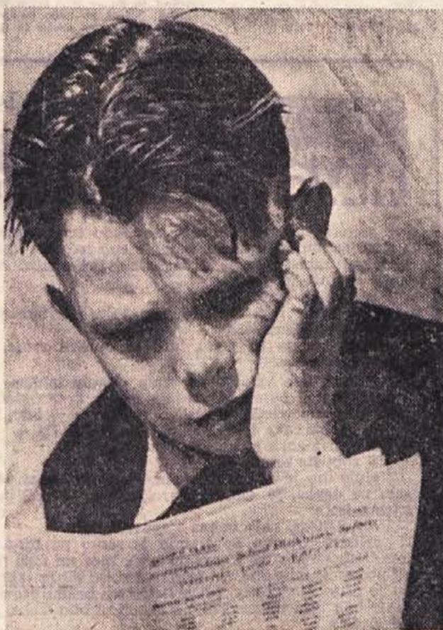
Spet so se odprla vrata naših šol: nadebudnim učencem in njihovim vzgojiteljem želimo kar največ uspehov v novem šolskem letu