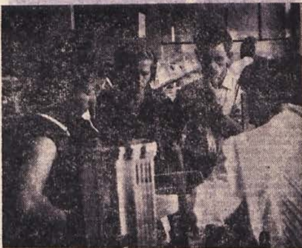
Včasih se tudi pri dobri postrežbi zgubi smeh z obraza — ob računu...