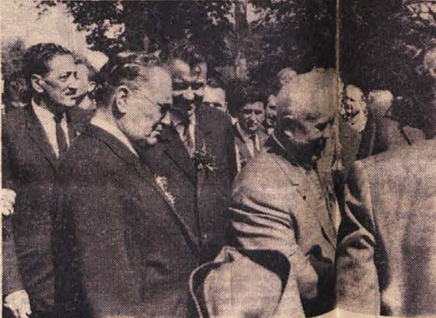
Z nedeljskega sprejema dragih gostov iz Sovjetske zveze na Otočcu: premier Hruščov se rokaje s predstavniki novomske občinske skupščine, občinskega komiteja ZKS in občinskega odbora SZDL.