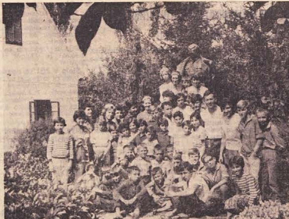
Takole so se Makedonki fotografirali pred rojstno hišo maršala Tita v Kumrovcu

12. oktobra zahteva: »Komunistična internacionala zahteva popolno jasnost glede požiga Reichstaga. Milijoni čakajo na odgovor... Milijoni čakajo na jasen odgovor!«