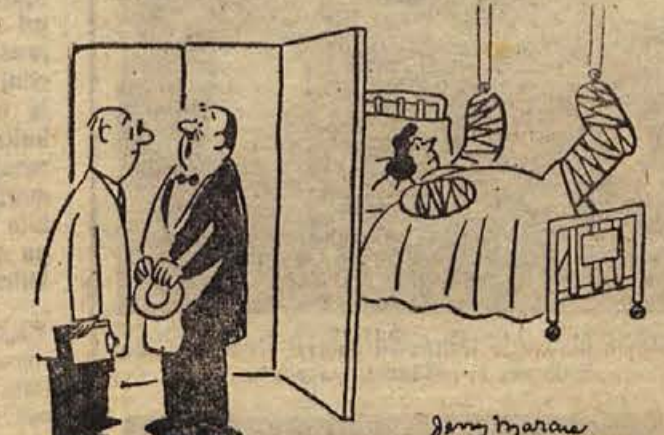
— In kdaj bo moja žena toliko okrevala, da bo lahko okna očistila do kraja?

Louis XIII. je bil le izvršilec zamislil takratnega mi- nistrskega predsednika, kardinala Richelieuja, ki je bil ra- zumen in odločen politik in se je v glavnem dosegel svoj življenjski cilj: spravil je francoske pleničnice na kolena. V vojaških spopadih kralj ni imel vedno sreče. Kljub temu pa so v Parizu po vsaki bitki prirejali velike bakladi in ognjemete. Kraljica Ana takih komedij ni marala in je nekega dne rekla svojemu možu: »Francoski se mi zdijo ko kreslini kamen. Bolj kot tol- češ po njem, bolj leti iskre od njega.«