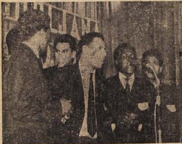
»Lumumbina smrt je rodila tisoče novih Lumumbov...« so peli postavni črnski fantje na novo-meškem odru

snemalci RTV Ljubljana in Beograd. Kmalu so vsi udeleženci te velike mladinske manifestacije nosili lep emblema z napisom »Veliki dan«. Aperitiv v impozantni dvorani hotela Otočec in slovesna otvoritev proslave.