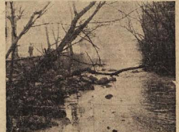
Motiv iz meglene Brestanice