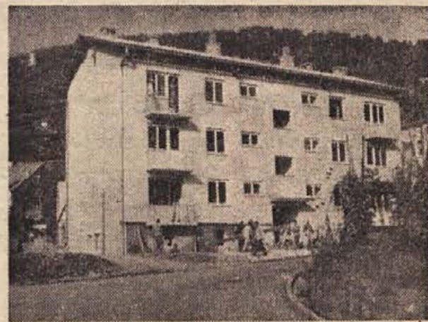
9-stanovanjski blok v Semiču, katerega je financiral Stanovanjski sklad črnomaljske občinske skupščine s soudeležbo tovarne kondenzatorjev v Semiču. Stavbo je zgradil novomeški Pionir, za dan republike pa so jo izročili svojemu namenu

■ Te dni je delovni kolektiv tovarne emajlirane posode v Celju izpolnil letni proizvodni plan v vrednosti 10 milijard dinarjev. Tak uspeh je tovarna dosegla prvokrat, odkar obstaja. Do konca leta bo doseženih okrog 11 milijard dinarjev bruto produkta.