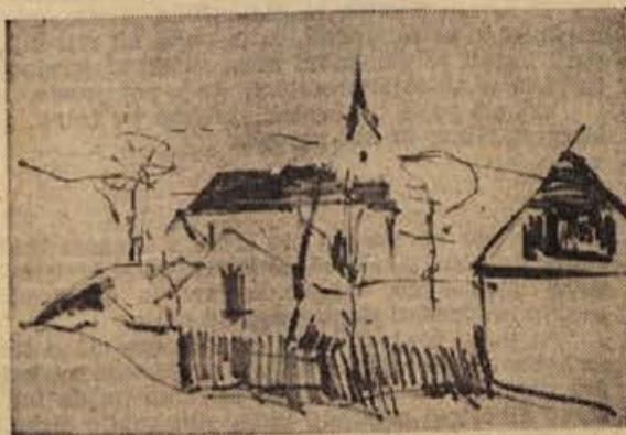
Miro Kugler: PEČICE (1961)