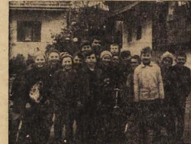
Takole se poslovijo leskovski šolarji sredi vasi, ko je konec popoldanskega pouka

V zimskih mesecih bo krajevna organizacija usmerila svoje delo pred-