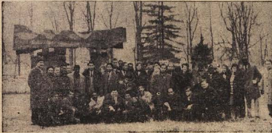
Brigadirji in njihovi gostitelji so obiskali tudi Kostanjevico na Krki, kjer so si ogledali razstavo kipo v galeriji FORMA VIVA na prostem

cembrski dan. Vedro razpoloženje, proslava z res bogatim sporedom. Hladno, suho vreme ni kvarilo načrta organizatorjev ne dobre volje slavlencev. Kot vedno je bila to tipična mladinska manifestacija, do kraja izpolnjena s prijetnim vzdušjem mladosti.