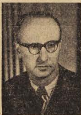
V šolskem letu 1938-39 je odšel na Poljsko kot štipendist Slovenskega inštituta na

Jesen 1934 se je vpisal na slavistični oddelek filozofske fakultete v Ljubljani. Tu si je pod vodstvom izbornih akademskih učiteljev Prijatelja, Kidriča, Nahtigala in Ramovša poglobil znanje o domačem jeziku in književnosti ter razširil pogled v svetovno literaturo, posebno slovansko. Poleg študija pa se je posvečal tudi političnemu življenju med akademsko mladino in bil član levičarsko usmerjenega Slovenskega kluba.