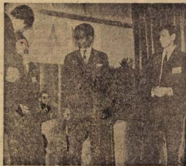
»Pogledi, kako govoriš slovensko ali srbsko...« — bili smo presenečeni, kako lepo obvladajo drugopolti mladeniči naš jezik (z nedeljskega slavlja v Novem mestu)

Projektivno podjetje v Novem mestu je 20. oktobra predalo občinskemu organom projekt urbanistične ureditve vplivnih področij, ki je potreben v zvezi z urbanističnim načrtom Novega mesta. Ta projekt rešuje ureditev okoliških naselij, kot so Dol, Toplice, Straža z Vavto vasjo, Senjernej, Zužemberk ter Šmarjeta in Otočec, ki se bodo v persepektivi razvijala skladno z Novim mestom in nanj navezovala v raznih pogledih. Teh 5 naselij, ki so vplivna področja, je izbral Svet za urbanizem pri Občinski skupščini v Novem mestu. Šmarjeta in Otočec sta mišljenja kot poseben, zgolj turistični okoliš.