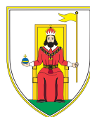
Mestna občina Novo mesto