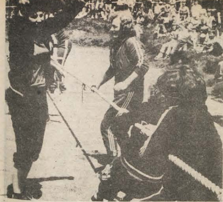
DOBRO POVELJE – Čvrst poteg pri vlečenju vrvi je v Lisci domena delavk. Senovčanke na sliki so si priborile drugo mesto vse skupaj je zadostovalo za ekipno zmago in prehodni pokal. (Foto: A. Železnik)