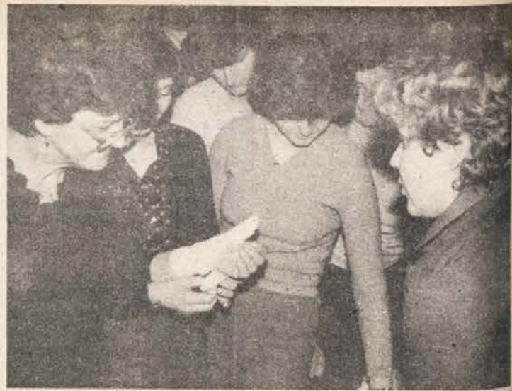
PRIPRAVE NA TEKMOVANJE — Ženski ekipi civilne zaščite z Radoviče in iz Slamne vasi se vestno pripravljata na občinsko tekmovanje, ki bo konec prihodnjega meseca v Rosalnicah. Prejšnjo sredo so pod vodstvom zdravnice iz metliškega zdravstvenega doma v radoviški šoli vadile prvo pomoč.