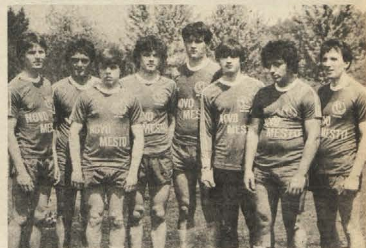
IGRALI ZA POKAL: Nogometna ekipa slušno prizadetih Novo mesto se je v hudi konkurenci izkušenih dobro borila in na koncu med šestimi ekipami slovenskih centrov zasedla četrto mesto.

Med moškimi je v 19. kolu SRL ekipa Krškega izgubila v Trbovljah s 25:36 (14:14), vendar je ostala na 6. mestu z 19 točkami. V 20. kolu igrajo Krčani doma z Mokrcem.