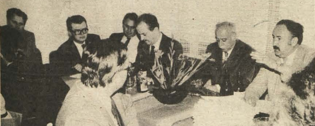
ODKRITO O TEŽAVAH IN NAPAKAH - Člani začasnega kolektivnega poslovnega organa v IMV so v petek predstavnikom najvišjih republiških teles podrobno obrazložili težave, v katerih je danes ta tovarna, hkrati pa nakazali že prve sadove komaj tritedenskega dela poslovnega organa pri izdelavi sanacijskega programa.