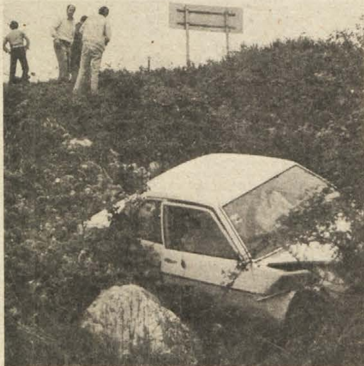
SE ENA ŽRTEV — Nevarni ovinek pred suhorsko žago je prejšnji teden zahteval še eno pločevinasto žrtev. Vozilo, s katerim so se peljali iz Nemčije domov štirje hrvaški zdomeci, je na spolzki cesti zaplesalo in zdrknulo po strmini. Na srečo ni bil nihče ranjen, na avtomobilski pločevini pa je bilo precej škode. Ta ovinek je v dežju neprijetno presenetil že precej voznikov; kaže, da radi spregledajo opozorilni znak o obveznem zmanjšanju hitrosti.