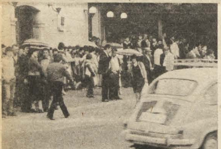
POD MILIM NEBOM — Niti eno občinsko središče v dolenski regiji nima prave, urejene avtobusne postaje. Črnomaljsko avtobusno postajališče zlasti ob drugi uri popoldne gotovo ne prispeva k boljši prometni varnosti.

Najboljši se bodo udeležili republiškega tekmovalnega kovinarjev, ki bo v občinah Črnomelj, Krško in Novo mesto in na katerem se bo pomerilo okoli 400 tekmovalcev iz vse Slovenije. V Črnomlju se bodo pomerili livarji in kovači, v Semiču pa orodjarji in rezkalci.