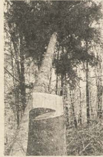
ROMSKI STIL — Romske gozdne tatvine je lahko prepoznati po značilnem poseku v višini kolen ali pasu.