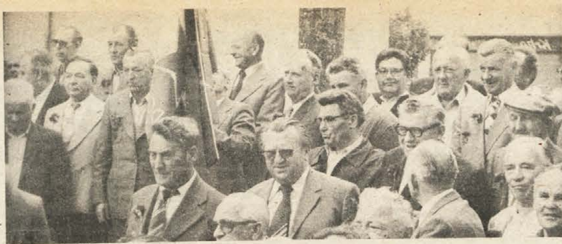
SNIDENJE PO 40 LETIH — Večina od 120 še živečih borcev 1. dolenjskega bataljona oziroma 5. slovenskega partizanskega bataljona je prišla v nedeljo na snidenje v Dol. Toplice, kjer so ob jubileju razvili svoj prapor. Iz tega bataljona je 5 narodnih herojev, od teh trije še živijo.