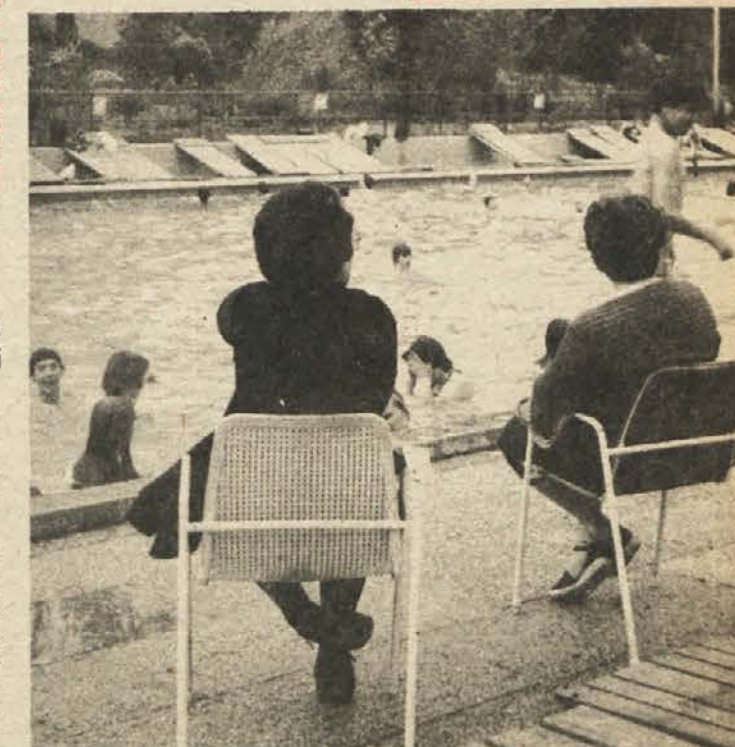
OD NEDELJE VIŠJE CENE - Kopalna sezona se je v Dolenjskih Toplicah začela že pred 1. majem. Med tednom ni navala, konec tedna pa je v bazenu tudi po 300 kopalcev. Posnetek je z zadnje nedelje, ko je začela veljati nova cena: vstopnina za odrasle je 50 din.

Kot rečeno, šlo je za vsestransko osvetlitev dobrih pa tudi nevspešnih značilnosti delegatskega sistema. Gradiva, ki so ga za posamezne teme pripravili poznavalci (udeleženci se-