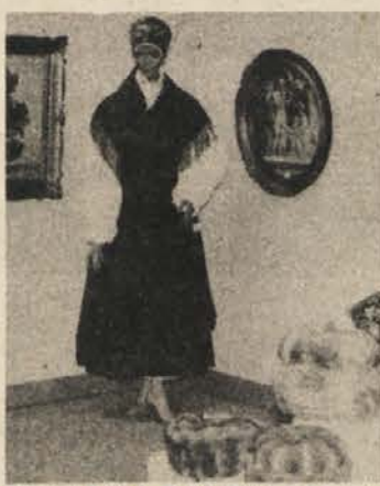
POKAZALI, KAJ ZNAJO – Na razstavi „Naš prosti čas“ so občani Kočevske prikazali svoja ročna dela, in sicer narodne noše, avbe, gobeline, polhovke, prtičke, prte in druge izdelke. Razstava je bila v Likovnem salonu.

Spretni izdelovalci ročnih del in gobelinov so z razstavljenimi predmeti pokazali, kako se lahko bogato, koristno in kulturno izrabi prosti čas. Obiskovalci razstave so občudovali izdelke pa tudi potrpežljivost, trud in spretnost posameznih izdelovalcev. Razveseljivo je tudi – kar je pokazala razstava – da je v Kočevju in okolici veliko ljudi, ki se ukvarjajo z ročnimi deli. Gotovo je razstava spodbudila marsikatero obiskovalca, da se bo tudi on začel ukvarjati z ročnim delom. Velik uspeh pa bi bil, če bi razstava spodbudila tudi mladino k taki dejavnosti, saj prav mladi pogosto tožijo, da jim je dolg čas, ker nimajo kaj koristnega početi. Možnosti za udejstvovanje na področju ročnega dela je dovolj za starejše in za mladino, in to je zelo nazorno pokazala prav razstava. VILKO ILC