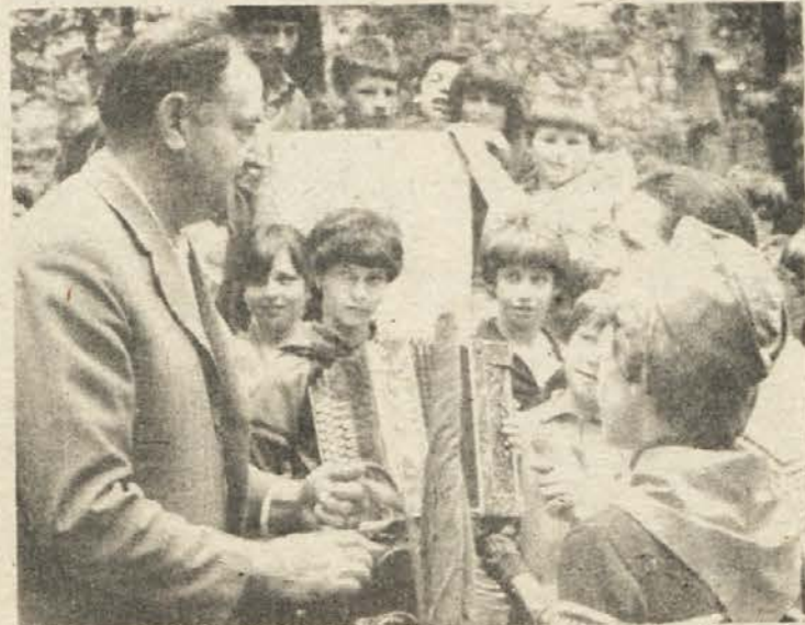
IZ RODA V ROD - Do osrednjega zbora pionirjev v Črnomlju bosta kurirska torba in zastava menjali mnogo pionirskih rok. Na sliki: prva predaja ob spomeniku Gubčeve brigade.