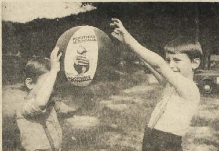
KOMPASOVA ŽOGA – Tudi majhne reči napravijo otrokom veliko veselja.

Ko boste vse to dobro prebrali, se zamislite. Odločitev prepuščamo vam! Mi smo vam samo povedali, kaj vam nudimo. Če se boste ogreli, vas vabimo v najbližjo Kompasovo poslovalnico (na Dolenjskem v Novem mestu in Ribnici) ali pa v urad katere izmed pooblaščenih agencij. Zvedeli boste cene, kdaj imamo še prostor in vse ostalo. Lahko pa nas pokličete tudi po telefonu.