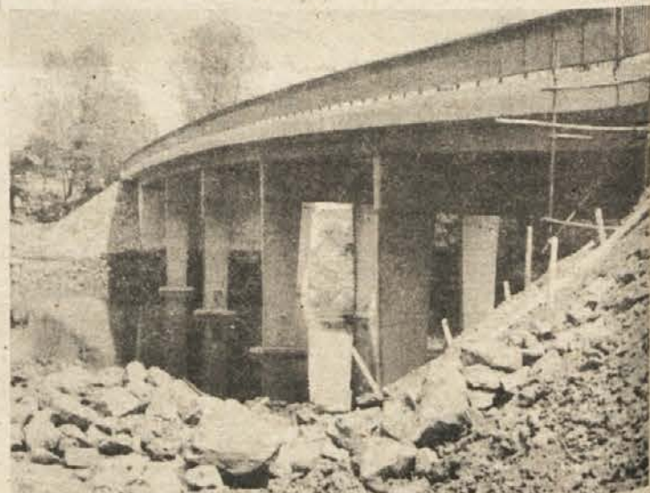
MOST PRIJATELJSTVA — Dela pri gradnji mostu čez Kolpo med Krasincem in Pravatino potekajo po načrtu. Most, ki bo veljal okoli 30 milijonov dinarjev — dobro tretjino te vsote bo prispevala metliška občina — bodo slovesno odprli 20. junija in ker povezuje dve sosednji obkolpski občini, metliško in ozaljsko, so predlagali, naj bi se imenoval „most prijateljstva“.

Brigadirji prve izmene mladinske delovne akcije „Bela krajina 82“ bodo od 27. junija do 17. julija delali pri rekonstrukciji vodovoda od Leše do Brezovice, ki meri 3166 metrov. Celjani, Tržičani, Ljutomerčani, verjetno pa tudi brigada Rdečega križa se bodo vsak dan vozili iz Vinice, saj bo letos brigadirsko naselje prvič v tamkajšnji osnovni šoli. Brigadirji druge in tretje izmene bodo delali na območju črnomaljske občine.