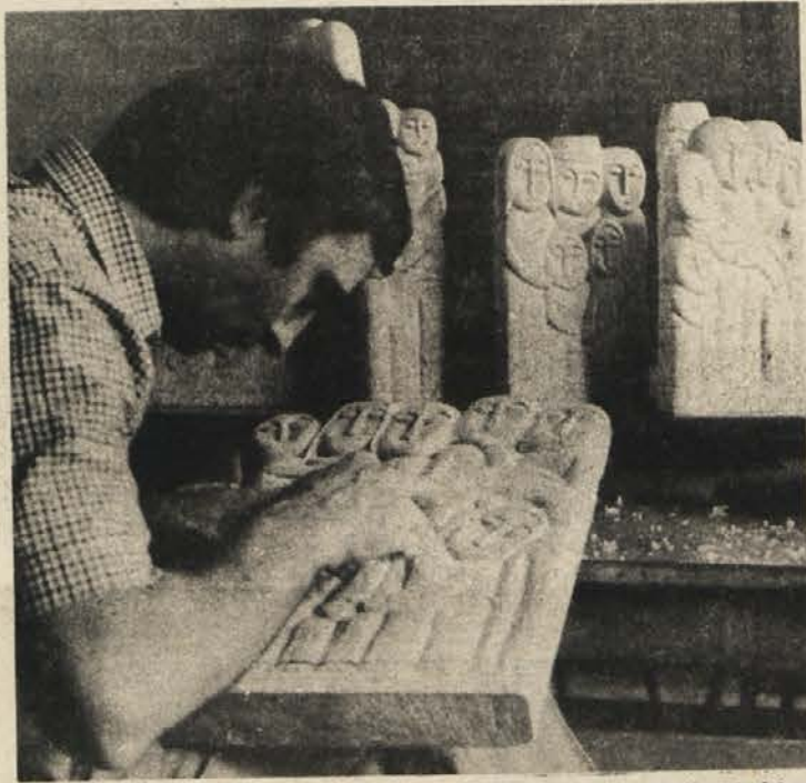
TABOR JE IZJEMA – Med okoli 25 likovnimi kolonijami, ki s spremenljivo srečo delujejo v Sloveniji, je trebanjski Tabor likovnih samorastnikov izjema. To ni le zategadelj, ker na njem ustvarjajo slikarji in kiparji tako rekoč z ramo ob rami, pač pa tudi zato, ker slovi kot ena najbolj organiziranih in samoupravno urejenih. Tabor ima od vseh kolonij na Dolenjskem tudi najdaljšo tradicijo, saj bo letos že štirinajstič.