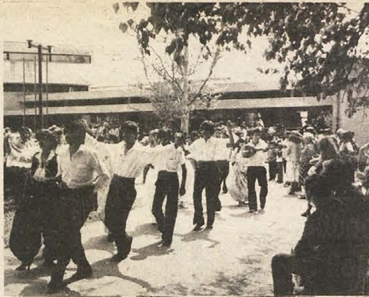
Velika romska prireditev v Novem mestu se je začela s sprevodom Romov po mestu.