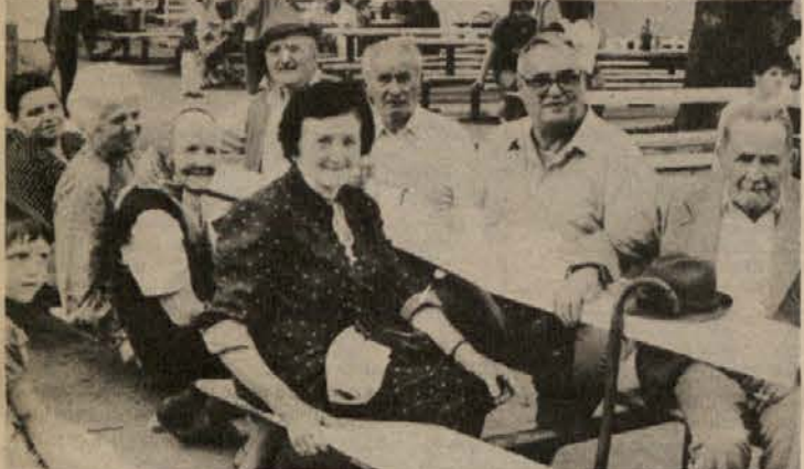
ŽIVE PRIČE PO 55 LETIH — Krajanje Gotne vasi so v soboto s proslavo in družabnim srečanjem počastili svoj krajevni praznik...