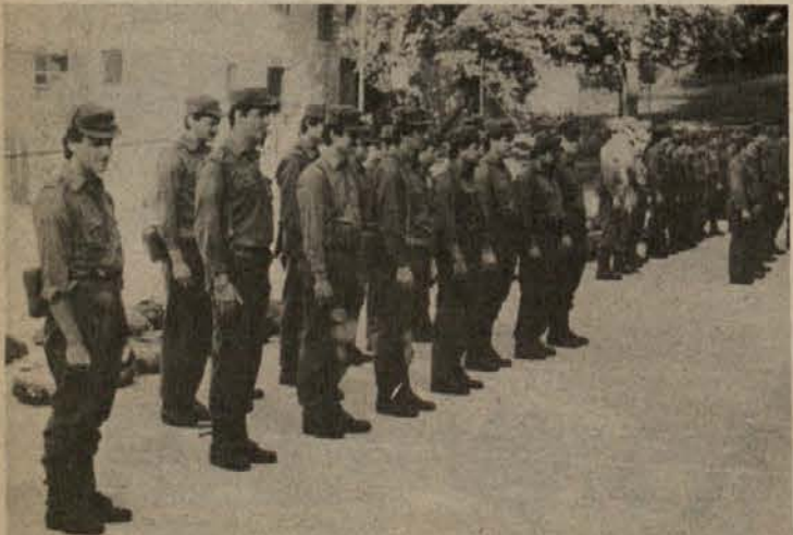
TERRITORIALNA OBRAMBA — Prejšnji teden so se na športnem igrišču na metliškem Pungartu zbrali pripadniki enote teritorialne obrambe iz metliške občine...