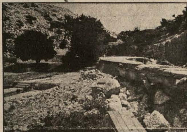
Od informbirojevskega obdobja 49—59 so na Golem otoku ostale ruševine.

Golega otoka nismo obiskali s prvo skupino sedemdesetih novinarjev. Izbrali smo simbolični datum 9. julij, točno »39 let potem« in se s skupino pravih turistov z Reke odpeljali z avtoBUSom Kvarner ekspresa do poldruge uro oddaljenega Jurjeva, nato pa z zaporniškim trajektom, ladjo za prevoz vode in zapornikov, do Golega