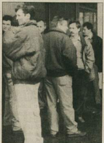
ČAKAJOČ NA NOVEMBRŠKE PLAČE - Takole so delavci Pionirjeve družbe MKO pred poslovno stavbo in v njej hoteli prejšnji četrtek s stavko priti do novembrskih plač.

krog se sklne in znova začne." V začetku leta se je vodstvo podjetja s