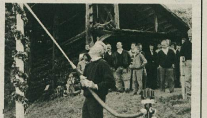
TEŽKO PRIČAKOVANA VODA TUDI V JAGODNIKU - Po dobrem letu in pol so si Jagodničani skupaj z vikendari in seveda s pomočjo trebanjske občine zgradili svoj vodovod. S simboličnim brigom vode na otvoritvi so tako zaključili z napornim delom, ki pa ga ni bilo malo, saj so skoraj vsa dela opravili sami.

Regijska koordinacija za Dolenjsko in Belo krajino IO regijskega SGF