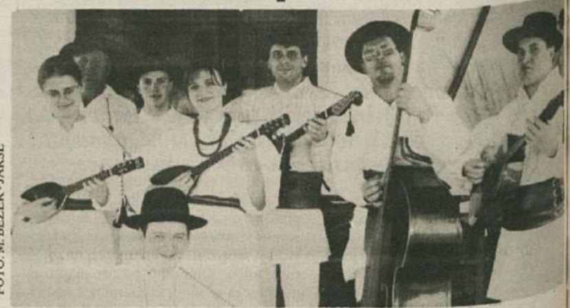
Tamburaši iz Dragatuša

Na različnih prireditvah in otvoritvah, ki jih zadnje čase po Beli krajini ne manjka, skoraj ne gre več brez tamburašev iz Dragatuša. Kaže, da se je uveljavilo nepisano pravilo, da vsak, ki da kaj nase, povabi Dragatušce, da zaigrajo in zapoje. A ne zgolj iz prestiža, temveč tudi zato, ker je njihovo igranje tako prijetno za ušesa in dušo.