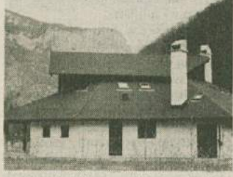
Kajakaški center "Stari malni"