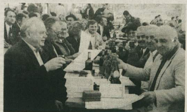
TAKO SO SE MEDALJ VESELILI TREBANJCI - Prejeli so največ medalj, saj so v oceno prinesli tudi največ vzorcev. Složno so sklenili, da bodo že naslednje leto med vzorce prinesli tudi kralja cvičkov '96.