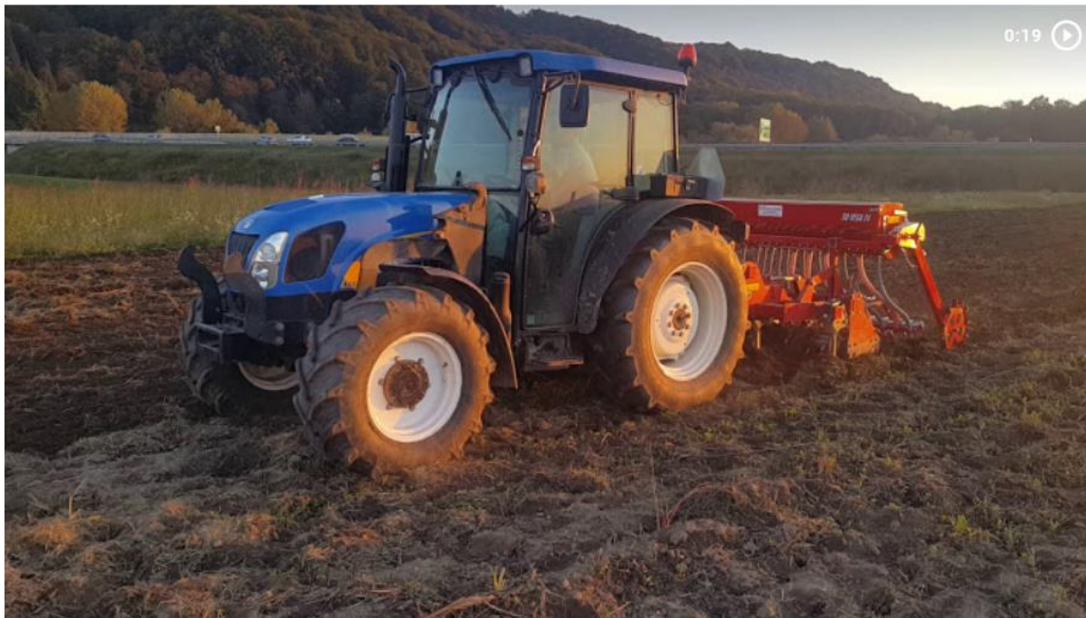
Podrahljavanje z ripperjem 30 cm globoko (oblika nogače je zelo pomembna), hitrost največ 5 km/h

Link za video škropljenje BD preparatov (video 20 sekund)