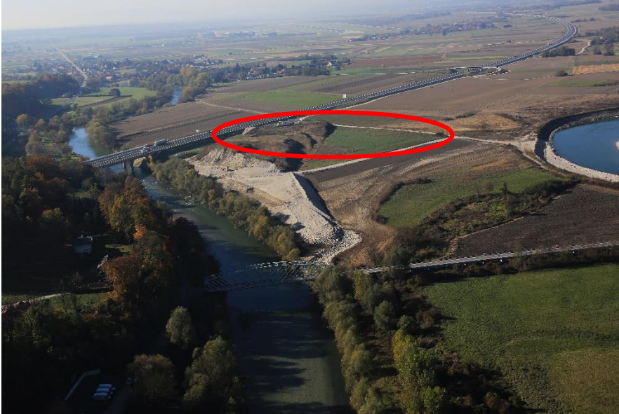
Začasna deponija materiala v času gradbenih del ob Hidroelektrarni Brežice (od 2014 do 2017)