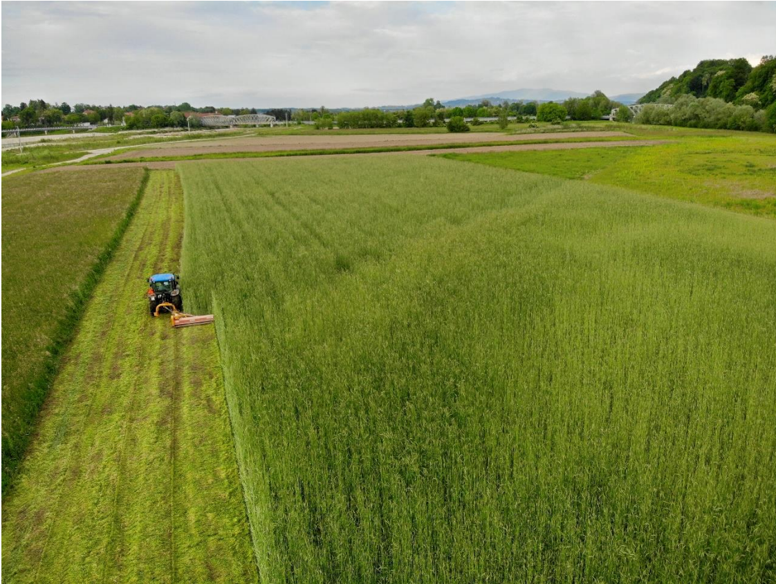
Mulčenje prezimne mešanice, maj 2019